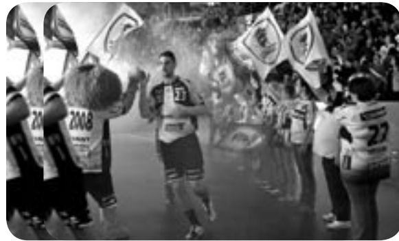
Familienstag mit vielen Maskottchen und Spenden-Aktion